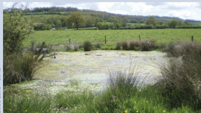
Lucie Laine - CSNB

L'objectif de ces rencontres est de mieux faire connaître la richesse patrimoniale du pays, de travailler sur les enjeux de gestion et de conservation des milieux naturels en association avec les acteurs locaux et la population locale.