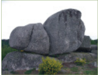
Le nez de chien

Le massif d'Uchon, surnommé la « Perle du Morvan », présente de nombreux attraits parmi lesquels ses forêts de hêtres et ses prés parsemés de blocs de granite . Il offre un point de vue splendide sur la région bocagère d'Étang-sur-Arroux, sur le Morvan et parfois, par temps clair, sur le Puy-de-Dôme.