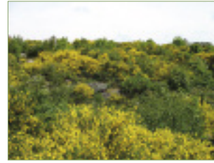
H. Hontang - CSNB

À l'automne, alors que les forêts prennent des tons bruns et orangés, la lande se colore du rose des Callunes.